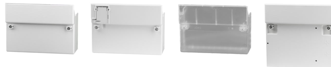
Klemmendeckel in unterschiedlichen Ausführungen