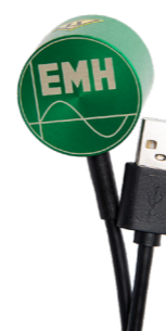
Optischer Kommunikationskopf (OKK USB)