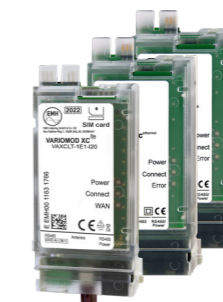
Zähler-Modem VARIOMOD (LTE, Ethernet) und Schnittstellenmodul (RS232, RS485)