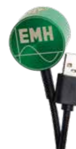
Optischer Kommunikationskopf (OKK USB)