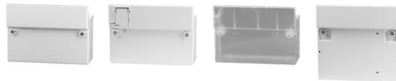
Klemmendeckel in unterschiedlichen Ausführungen