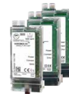
Zähler-Modem VARIOMOD-XC (LTE, Ethernet) und Schnittstellenmodul (RS232, RS485)