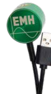
Optischer Kommunikationskopf (OKK USB)