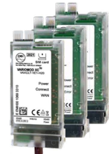
Zähler-Modem VARIOMOD-XC (LTE, GPRS, Ethernet) und Schnittstellenmodul (RS232, RS485)