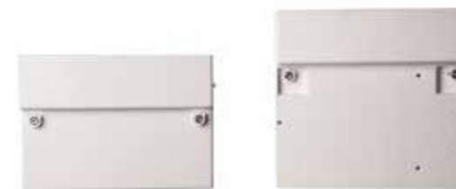
Klemmendeckel unterschiedlicher Länge Ausführung Standard: L = 130,0 mm Ausführung Lang: L = 167,5 mm