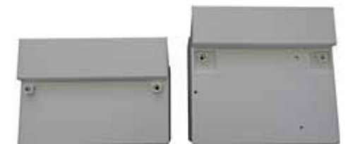
Klemmendeckel unterschiedlicher Länge Ausführung Standard: L = 130,0 mm Ausführung Lang: L = 167,5 mm