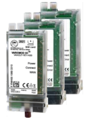
Zähler-Modem VARIOMOD-XC (LTE, GPRS, Ethernet) und Schnittstellenmodul (RS232, RS485)

Der LZQJ-SGM kann mit folgendem Zubehör funktional erweitert werden: