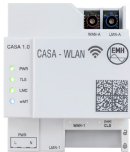
Smart Meter Gateway CASA

Das hat gute Gründe. Einer der wichtigsten: Das SMGW ermöglicht eine sichere und vertrauenswürdige Kommunikation. Wenn zukünftig Millionen von E-Autos in das Stromnetz integriert werden, muss die dafür bereitgestellte Infrastruktur gegen Hacker geschützt sein. Die vom Bundesamt für Sicherheit in der Informationstechnik (BSI)